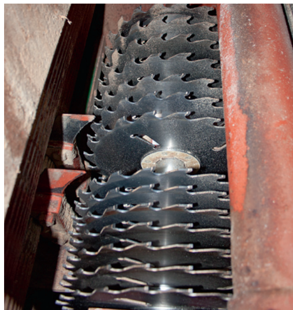
Die Aufspannung lässt sich in der KME3 fast beliebig variieren